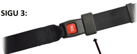
Abb. 2: Die mit Pfeilen gekennzeichneten Kunststoffkappen sind fest mit der Zunge verbunden und dürfen nicht gewaltsam entfernt werden!