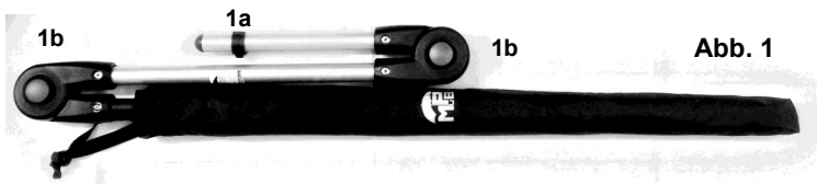
Abb. 1: Rollatorschirm

Inhalt der Verpackung: Rollatorschirm (Abb. 1), vormontierter Befestigungskloben (Abb. 2)